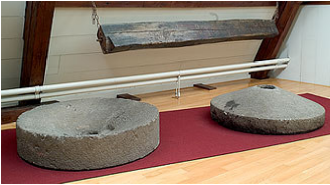
Twee Romeinse molenstenen. De rechtse paste ondersteboven in de linkse. Door de onderlinge wrijving werd het graan gemalen.