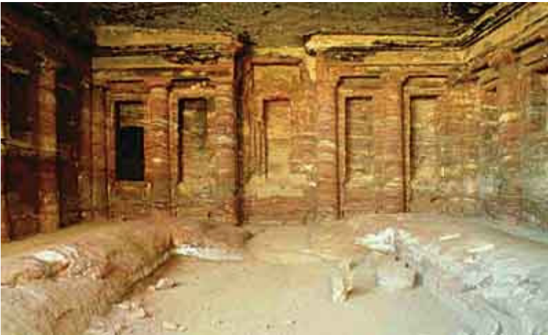
Triclinium of eetkamer

Negen of een veelvoud van negen was het juiste aantal personen dat aanwezig waren in het triclinium. De tafelschikking was hierbij heel belangrijk en gebeurde volgens een strikte etiquette. Aan de hoofdtafel zaten de gastheer, de gastvrouw en de eregasten. Recht tegenover hen zaten de andere gasten.